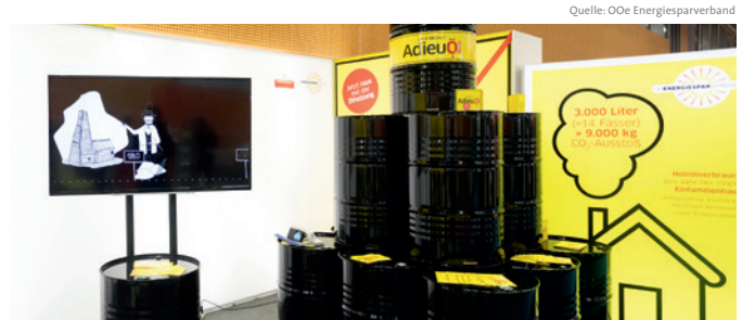
Informationskampagne „Adieu Öl“ für den Austausch von Ölheizungen in Österreich.